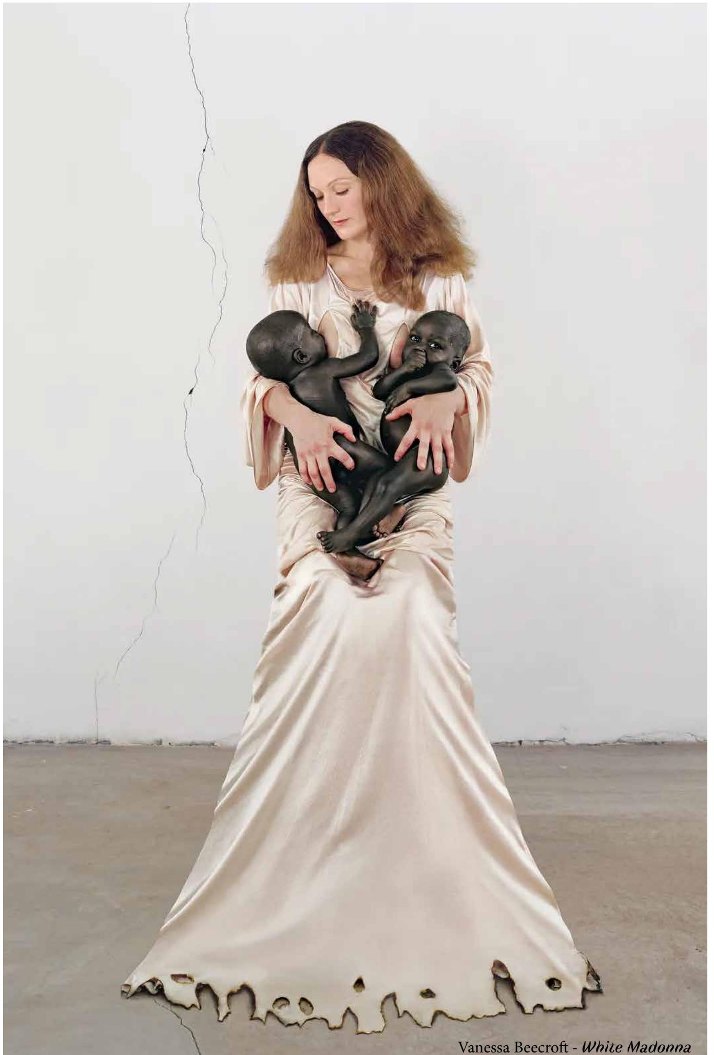
Vanessa Beecroft - White Madonna